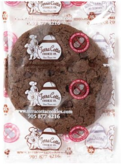
Fudge Chip DeLite *